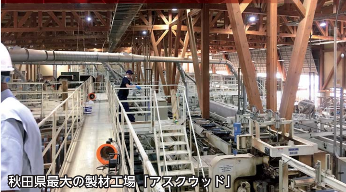
秋田県最大の製材工場「アスクウッド」