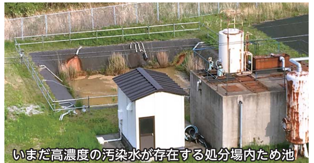
いまだ高濃度の汚染水が存在する処分場内ため池

今まで60億円以上かかった旧能代産業廃棄物処理センターの環境対策費は、31年度予算でも1億5千万円以上計上されています。対策の根拠の産廃特措法は平成34年で期限となります。