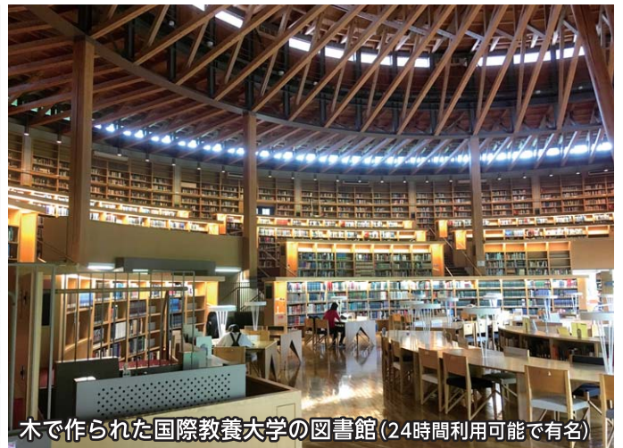
木で作られた国際教養大学の図書館(24時間利用可能で有名)

沢山の財産が秋田県の山には残っています。木の使い方が大きく変わった現代において今後の秋田県の木材産業について質問しました。