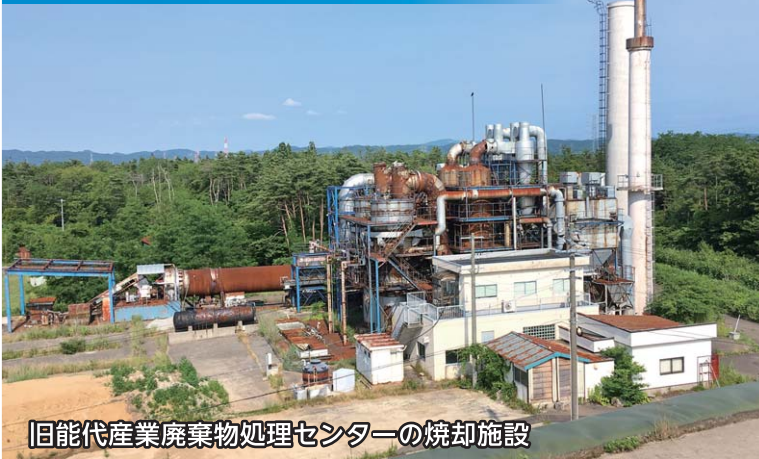
旧能代産業廃棄物処理センターの焼却施設