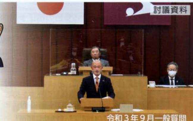
令和3年9月一般質問