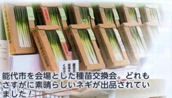
能代市を会場とした種苗交換会。どれもさすがに素晴らしいネギが出品されていました！