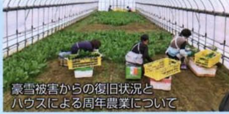
豪雪被害からの復旧状況とハウスによる周年農業について